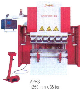
APHS 1250 mm x 35 ton